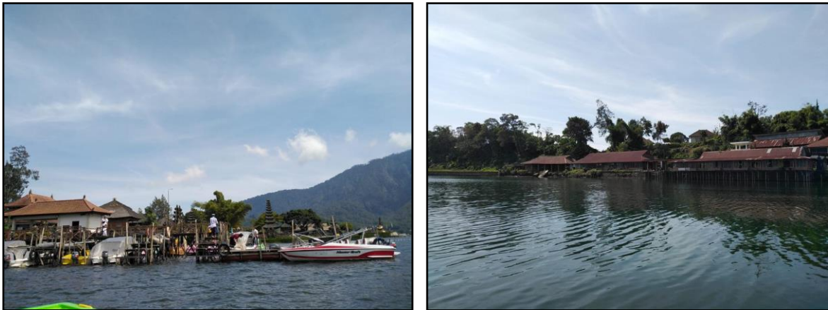
Gambar 2. Kondisi Pariwisata Danau Beratan